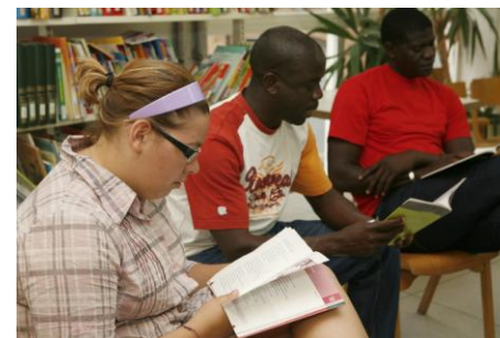
Club LF de la biblioteca Mestre Martí Tauler de Rubí