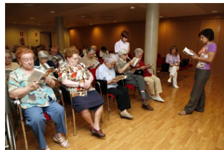
Club LF de l'hospital de dia de Manlleu en col·laboració de la biblioteca Bisbe Morgades