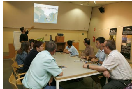
Club LF de la biblioteca de Viladecans en col·laboració del taller ocupacional Caviga

Les persones interessades en dinamitzar clubs LF poden posar-se en contacte amb una biblioteca o entitat per oferir-se com a voluntaris.